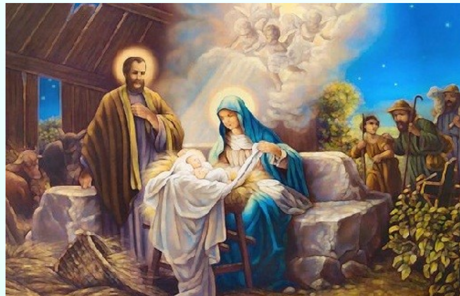
วันอาทิตย์ที่ 26 ธันวาคม วันฉลองครอบครัวศักดิ์สิทธิ์